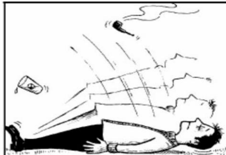
"Ary tahaka ny nanendrena ny olona ny ho faty indray mandeha, ary rehefa afaka izany, dia hisy fitsarana," Heb 9:27