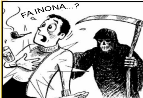
"Fa Andriamanitra kosa nanao taminy hoe: Ry adala, anio alina no halaina aminao ny fanahinao, ka ho an'iza izay zavatra noharinao?" Lioka 12:20