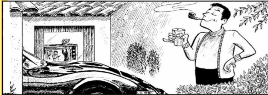
"Dia hilaza amin'ny fanahiko hoe aho: Ry fanahy ô, manana fananana be voatahiry ho amin'ny taona maro ianao; mitsahara, mihinàna, misotroa, mifalia." Lioka 12:19