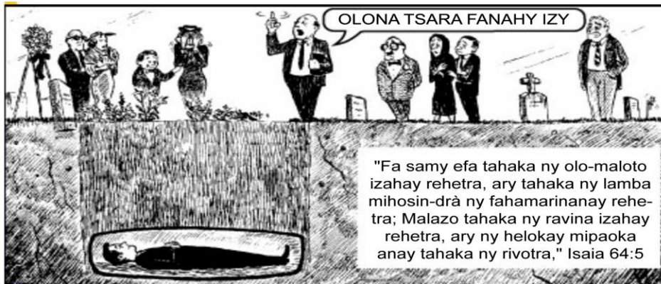
"Fa samy efa tahaka ny olo-maloto izahay rehetra, ary tahaka ny lamba mihosin-drà ny fahamarinanay rehetra; Malazo tahaka ny ravina izahay rehetra, ary ny helokay mipaoka anay tahaka ny rivotra," Isaia 64:5